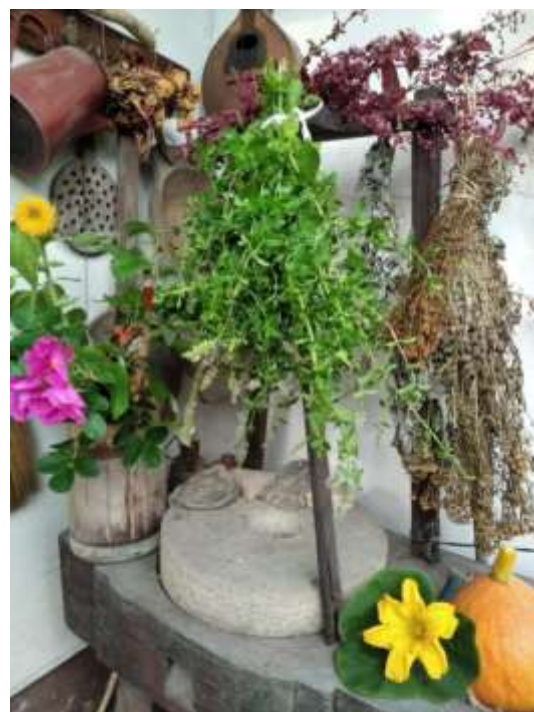
Fot. K. Jakubowska-Żółty